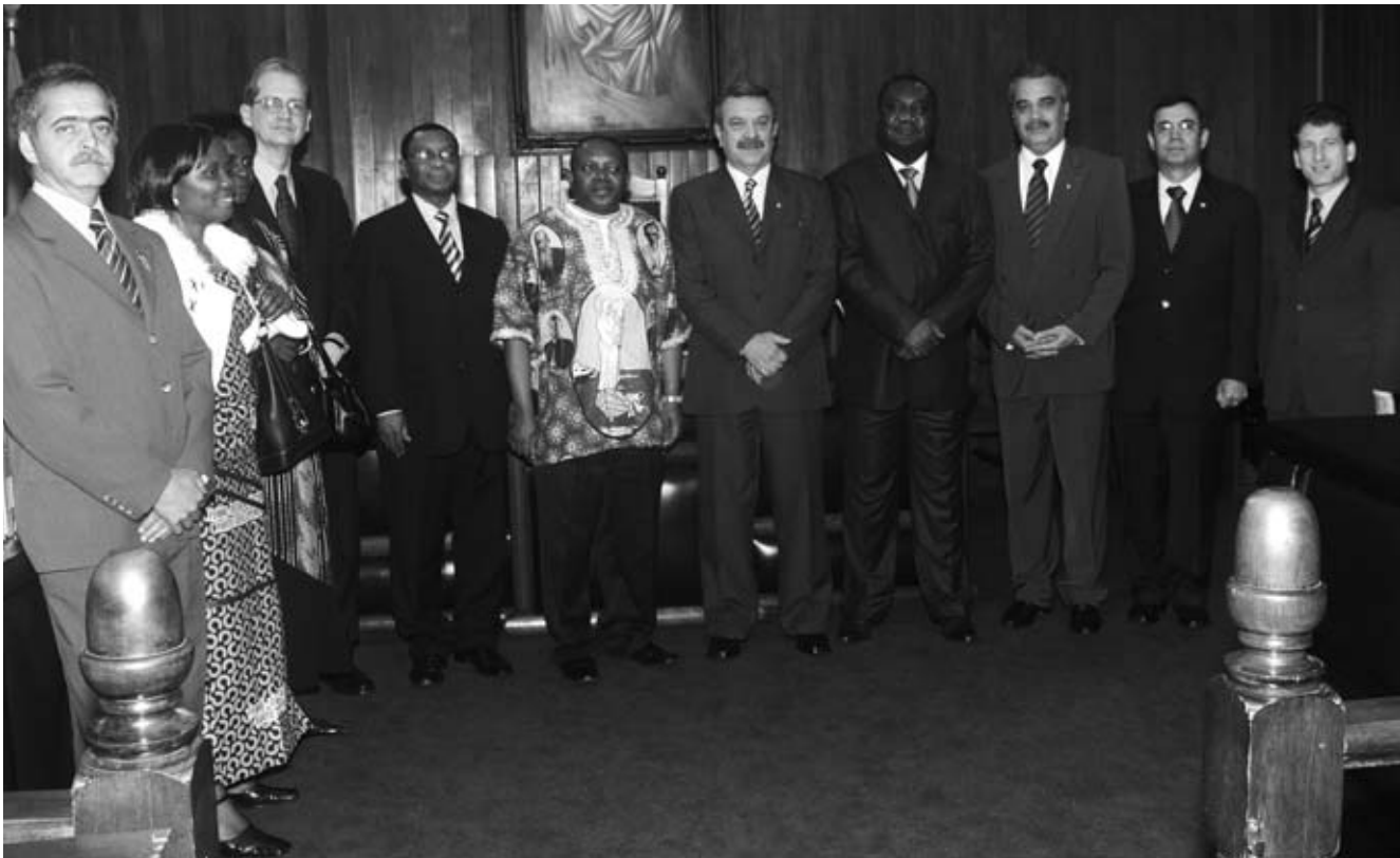
Lideranças congolenses durante a visita de cortesia aos juízes do Tribunal de Justiça Militar de Minas Gerais, no início do mês de outubro