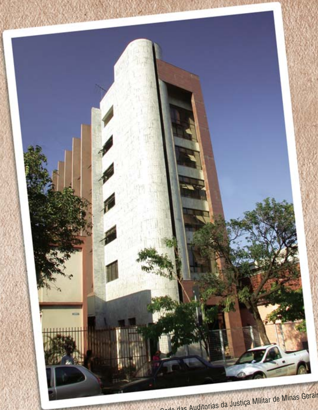
Sede das Auditorias da Justiça Militar de Minas Gerais