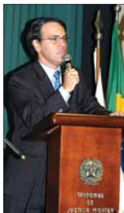
O Membro do Conselho Nacional de Justiça, Conselheiro Alexandre de Moraes, foi um dos palestrantes convidados