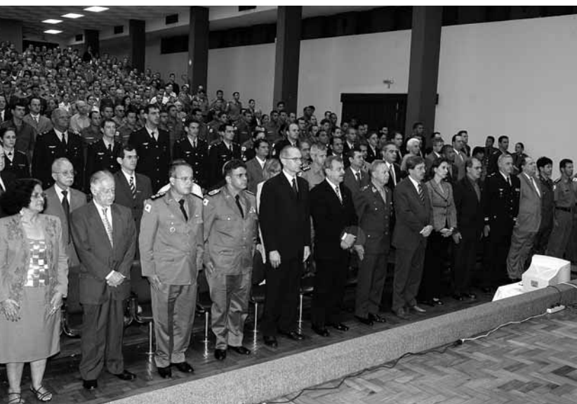
Auditório na abertura do Ciclo de Palestras

A conferência de encerramento, que teve como tema “O Conselho Nacional de Justiça e a valorização do magistrado”, novamente levou a abordagem para o âmbito nacional, visto que o Conselheiro Alexandre de Moraes,