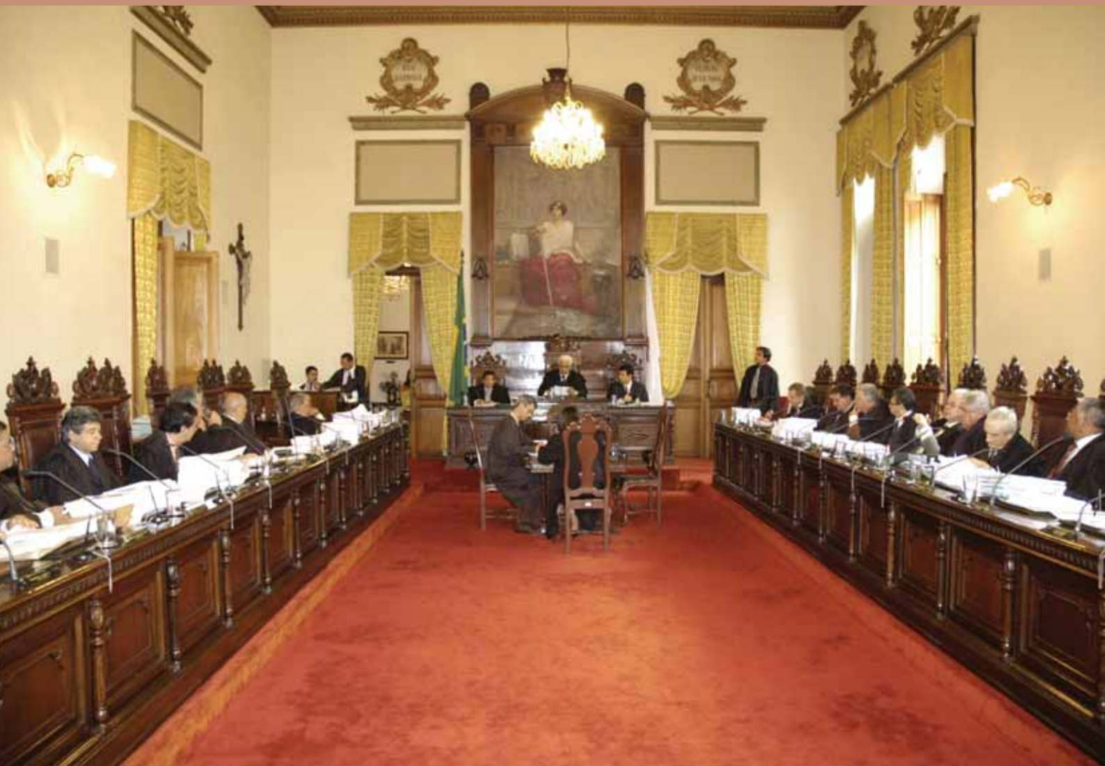
Corte Superior do Tribunal de Justiça de Minas Gerais - Belo Horizonte - MG