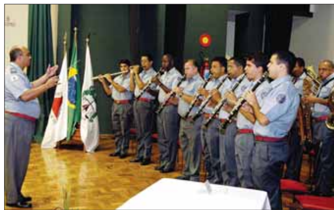
A Polícia Militar e o Corpo de Bombeiros Militar prestaram suas homenagens à Justiça Militar mineira através de apresentações musicais