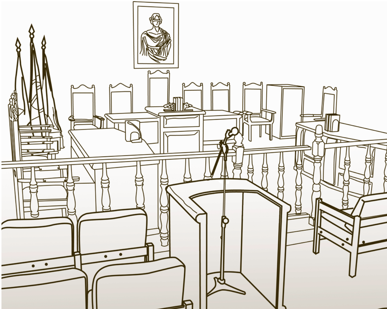
Plenário do Tribunal de Justiça Militar do Estado de Minas Gerais

Sem dúvida, uma das mudanças mais significativas foi operada pelo § 5º do art. 125 da Constituição da República. A partir da Reforma, compete ao juiz de direito do juízo militar decidir singularmente os crimes militares praticados contra civis. Assim, se um militar estadual praticar um crime militar, como constrangimento ilegal, ameaça ou lesão corporal, contra civil, o processo será instruído e julgado singularmente pelo juiz de direito. Porém, na mesma hipótese, se a vítima for outro militar, o processo será instruído e julgado pelo Conselho de Justiça.