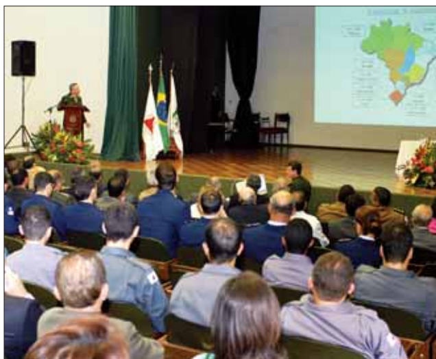
O Ministro General-de-Exército Max Hoertel proferiu palestra durante as festividades de aniversário da Justiça Militar mineira