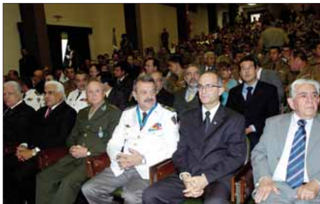
Diversas autoridades participaram das comemorações dos 69 anos da Justiça Militar estadual