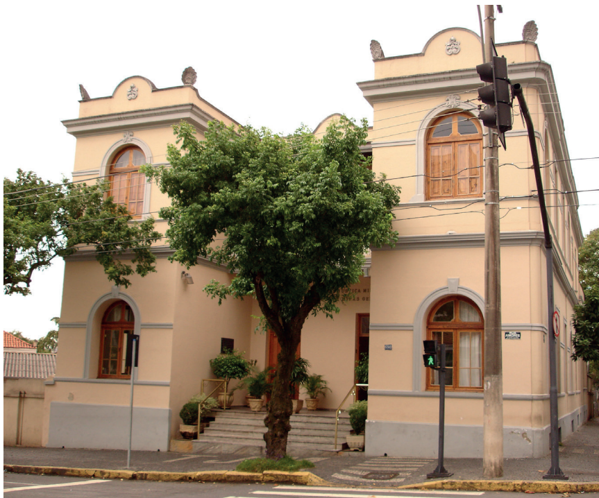
Antiga sede do Tribunal de Justiça Militar do Estado de Minas Gerais, localizada na Rua Aimorés, 689, Funcionários - BH/MG. Hoje, abriga o Museu dos Militares Mineiros.

vão da Rocha, foi publicada a Resolução n. 193 - TJMMG, que regulamentou a implantação do eproc na Justiça Militar de Minas Gerais. A regulamentação abarcava algumas classes iniciais como os inquéritos policiais militares, autos de prisão em flagrante e ações penais decorrentes e seus recursos ao Tribunal, além do habeas corpus no segundo grau de Jurisdição.